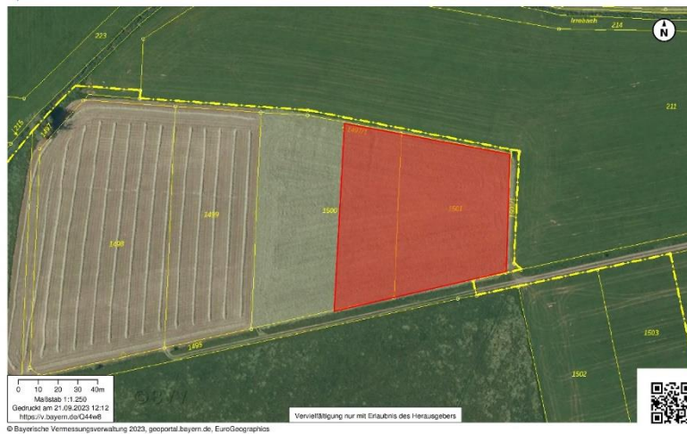
Externe Ausgleichsfläche zum Artenschutz: Flurstück 1500 (Teilfläche) und 1501 in der Gemarkung Großenried, Gemeinde Bechhofen